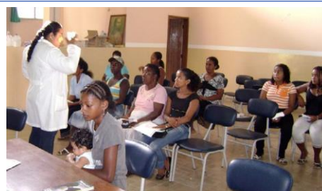
Medicinsko osoblje održava obuke za liječenje i sprječavanje HIV-a/side, kao dio Programa za pomoć osobama koje traže međunarodnu zaštitu, koji pokriva granice Kolumbije sa Ekvadorom, Panamom i Venecuelom.

U Karipskoj regiji, IOM je saradivao sa Pankarispkim partnerstvom protiv HIV-a/side (PANCAP) kako bi poboljšao pristup uslugama vezanim za HIV za migrante. IOM ima i ulogu sekretara Zajedničke inicijative Ujedinjenih Nacija za migracije, zdravstvo i HIV u Aziji (JUNIMA), koja razvija pristup prevenciji HIV-a, liječenju, njezi i podršci za migrante u Aziji.