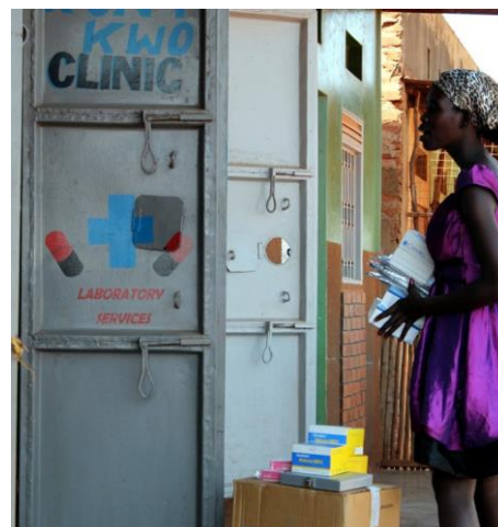
IOM snabdijeva klinike u žarištima u Ugandi medicinskom i laboratorijskom opremom.

Ovo su geografska područja gdje mobilnost stvara okruženje pogodno za povećane zdravstvene rizike u zajednici. To mogu biti mjesta gdje migranti žive, rade, prolaze ili iz kojih dolaze. Identifikovanjem ovih mjesta, IOM raspoređuje sredstva kako bi dosegao rizično stanovništvo. U Ugandi je, na primjer, IOM koristio pristup osjetljivih mjesta kako bi proširio testiranje adolescenata i mladih ljudi u žarištima na glavnom koridoru i većim rudarskim područjima. Aktivnosti u okviru ove inicijative uključuju pružanje usluga testiranja i liječenja, i dešavanje u vezi mobilizacije zajednice koja uključuju širu zajednicu u prevenciju.