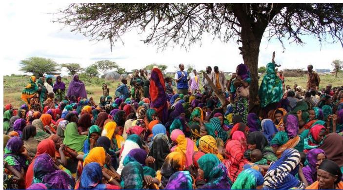
IOM radi na podizanju kolektivne svijesti o HIV-u i sidi u Etopiji.

U 2017. je IOM implementirao projekte vezane za HIV u 9 od 35 zemalja na listi UNAIDS, a to su: Mijanmar, Južni Sudan, Uganda, Malavi, Mozambik, Južna Afrika, Svaziland, Zambija i Lesoto.