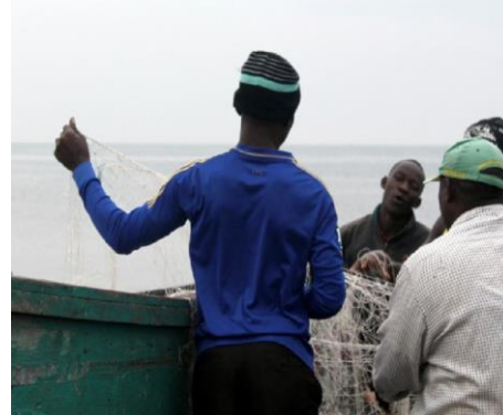
U Ugandi oko 130 000 ljudi živi u ribarskim zajednicama i procjene ukazuju na to da je zaraženost HIV-om u ovim zajednicama skoro 3-4 puta veća od nacionalnog prosjeka odraslih osoba.

Kada god je to moguće, IOM podržava integraciju HIV-a u primarno zdravstvo, usluge u vezi polnog i reproduktivnog zdravlja i tuberkuloze kako bi osigurao pristup sveobuhvatnim i integrisanim uslugama za HIV i zdravlje, onima koji žive sa HIV-om ili rizikuju da se zaraze. U Mijanmaru, IOM podržava kombinovane usluge za HIV i tuberkulozu na nivou zajednice omogućavajući pacijentima koji boluje od tuberkuloze da se testiraju na HIV i pružanje kućne njege za zaražene. U kriznim situacijama (uključujući Južni Sudan, Sudan i Liban), IOM je podržao pružanje osnovnih usluga za HIV kroz programe primarnog zdravstva za interno raseljena lica i izbjeglice u fiksnim i mobilnim klinikama uz pomoć zdravstvenih radnika zajednice. U Lesotou, Malaviju, Mozambiku, Južnoj Africi, Svazilandu i Zambiji, IOM podržava uvođenje minimalnog paketa SRH u zdravstvenim ustanovama za migrante. Ovaj paket uključuje planiranje porodice, prevenciju i liječenje HIV-a i side, preporođajnu njegu, polno zdravstvo i prevenciju SGBV i štetnih kulturnih i tradicionalnih praksi u okolnim zajednicama.