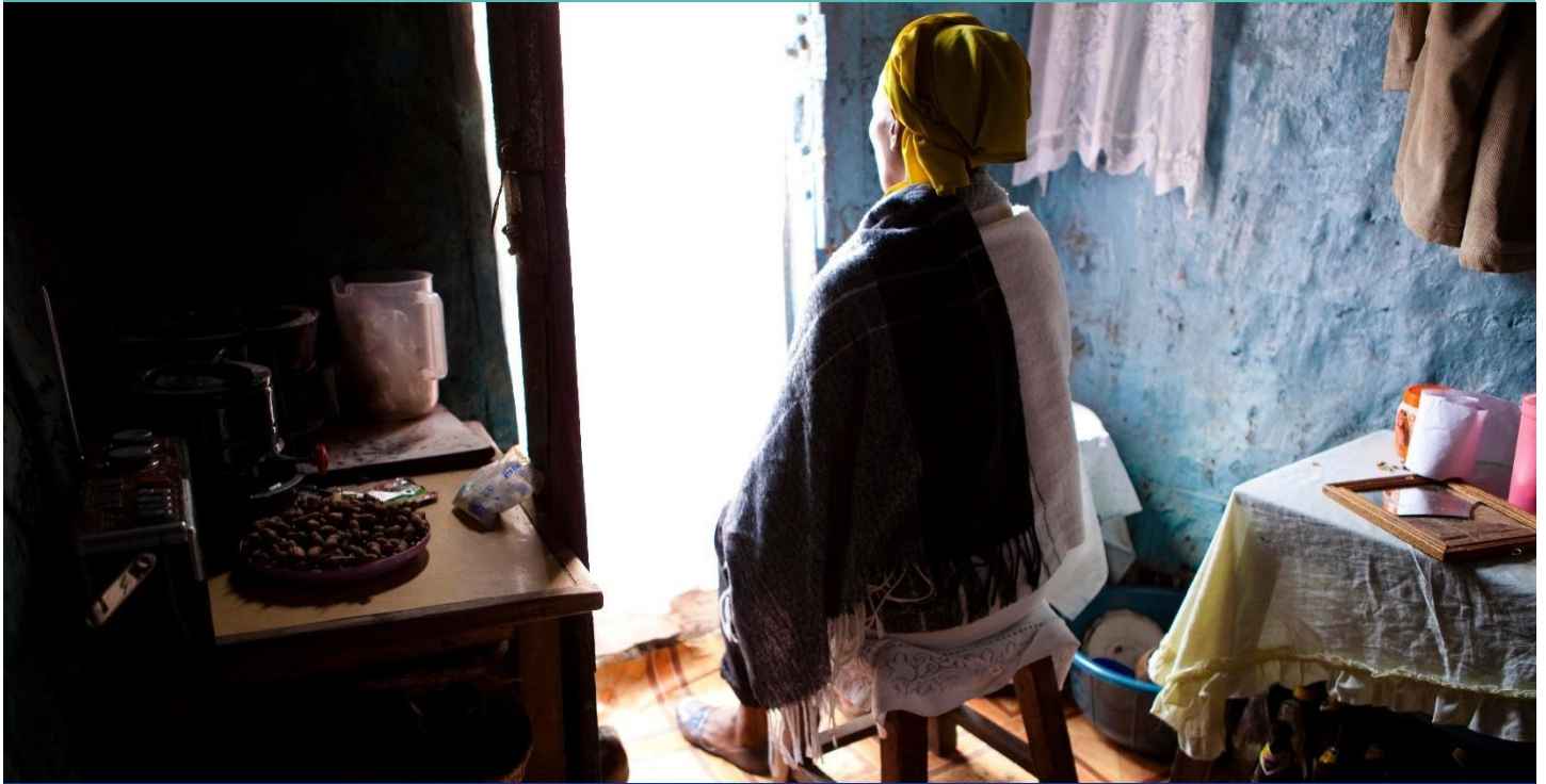
Seksualna radnica pozitivna na HIV razmišlja o odlasku iz Tanzanije u Keniju u potrazi za boljim životom, dok čeka mušterije.